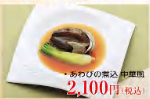
・あわびの煮込 中華風 2,100円(税込)