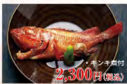
・キンキ煮付 2,300円(税込)